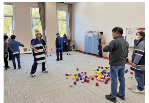
▲昨年のペギーボール体験

ボッチャ体験、ほっとマルシェ(お菓子や雑貨などの販売)、障害がある方への理解の促進や権利擁護を推進するためのポスター展示、スタンプラリー 問 障害者支援課・内線385