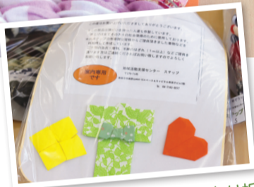
梱包用の台紙も、絵を描いたり折り紙を貼ったりして、制作者が心を込めて作っています。