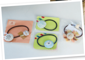
アクセサリや、イラストなどを転写したオリジナルのTシャツ・トートバッグも!