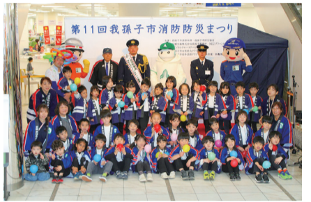
▲令和6年の消防防災まつり(右上がたすけくん、左上がすくうくん)

内容 一日消防署長任命式、我孫子市幼年消防クラブ・アビカルチャースクールキッズダンスの演技披露、バルーンアート、防火防災啓発品の配布、子ども用防火服着体験、たすけくん・すくうくん記念撮影など