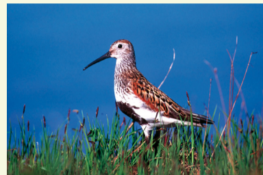
▲アラスカの北部に分布する亜種キタアラスカハマシギ

場所 鳥の博物館2階多目的ホール 内容 日本に渡来するシギ・チドリ類の中でもなじみの深いハマシギは、世界で10ほどの亜種が知られています。日本に冬鳥または旅鳥として渡来するハマシギは、どのあたりで繁殖する何という亜種が飛来するのでしょうか？カラーフラッグによる調査や形態の研究などから分かったこととお話します。