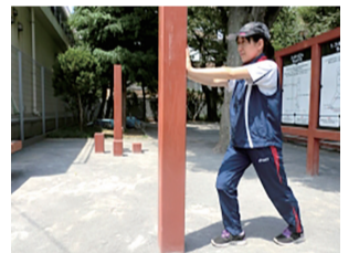
▲つまずかない運動

うんどう遊具の使い方などを紹介する講習会を開催します。公園に設置された遊具を使って健康づくりを楽しく行いますので、ぜひご参加ください! ◎天王台西公園うんどう遊園 日時 11月15日(金)午前10時～11時 ◎湖北台中央公園うんどう遊園 日時 11月19日(火)午前10時～11時 〈共通〉 雨天中止 対象 市内在住のおおむね65歳以上の方 費用 無料(申込不要) 持ち物 飲み物、タオル、動きやすい服装・靴・帽子 問 高齢者支援課☎7185-1112