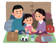
図 市民安全課・内線217