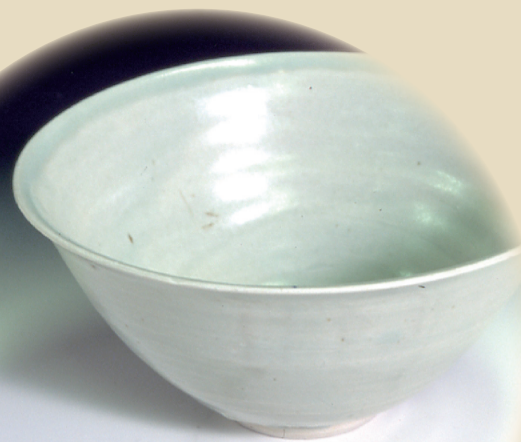
バーナード・リーチ「白釉花鉢」