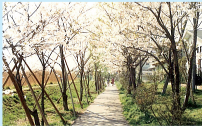
▲昭和62年3月撮影：手賀沼遊歩道

手賀沼遊歩道の整備は今から49年前の昭和46年から始まりました。ヤナギやニセアカシア、ソメイヨシノが植えられ、昭和54年に遊歩道の使用が開始、平成6年には整備が完了しました。手賀沼を眺望しながらの散策や休息は、昔から人々のくつろぎの場となっています。近年「さくらプロジェクト」として、市民の方から70本の桜の寄付を受け、全長5.3kmに及ぶ遊歩道には、今では約500本、21種類の桜があり、3月から4月にかけて多くの桜を楽しむことができます。