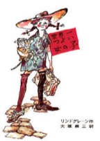
長くつ下のピッピ

著者が娘に語り聞かせた物語が元となった作品。何者にも縛られず自由であるが、わがままなのではなく心温かいピッピの姿に、子どもも大人も目が離せない。