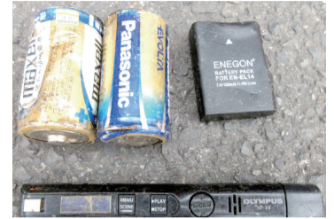
▲電池やバッテリーが混入

その他、ブロックやれんが、ペットボトルではないプラスチック製品が入っていました。