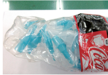
▲ペットボトルにインスリン注射器が混入