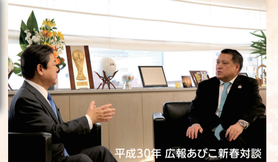
平成30年 広報あびこ新春対談

昭和32年11月21日生まれ。我孫子市に9年間在住。平成11年U-16日本代表監督就任。平成23年東アジアサッカー連盟副会長就任。平成24年(公財)日本サッカー協会副会長就任。平成28年東アジアサッカー連盟会長就任、(公財)日本サッカー協会会長就任(現在3期目)