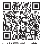
▲出展者・参加者募集