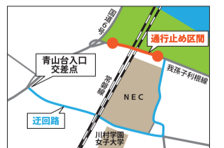
▲通行止め区間・迂回路図

期間 10月上旬～中旬の10日間程度(予定) 時間 午後9時～翌午前5時 場所 青山地先(右図参照)※全面通行止め 〇 (発)千葉県柏土木事務所 ☎7167-1201 (受)博正建設 ☎7182-4165