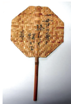
▲楚人冠うちわ「一貫の身と膝たたく裸かな」