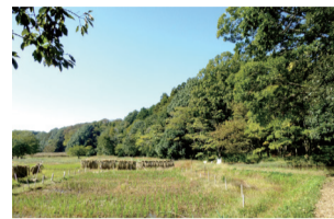
▲岡発戸・都部の谷津

内容 下ヶ戸の屋敷林を通り抜け、かじ池では遊歩道をゆっくり散策します。岡発戸・都部の谷津では、自然が人の手で守られている様子を観察し、4つの八景を楽しみながら歩きます。