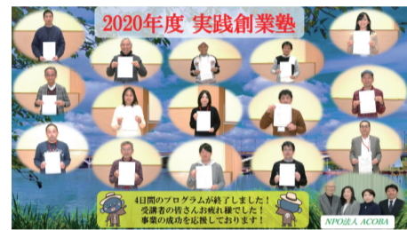
▲昨年度の修了生の皆さん

内容 専門家による講義や創業者の事例紹介などのほか、グループワークで起業・創業に必要な知識を学ぶことができます。受講者には法人設立時の登録免許税の軽減、創業関連保証額の拡充、市の創業支援補助金の補助対象資格など、さまざまな特典があります。