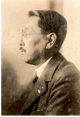
図 杉村楚人冠記念館 ☎7187-1131