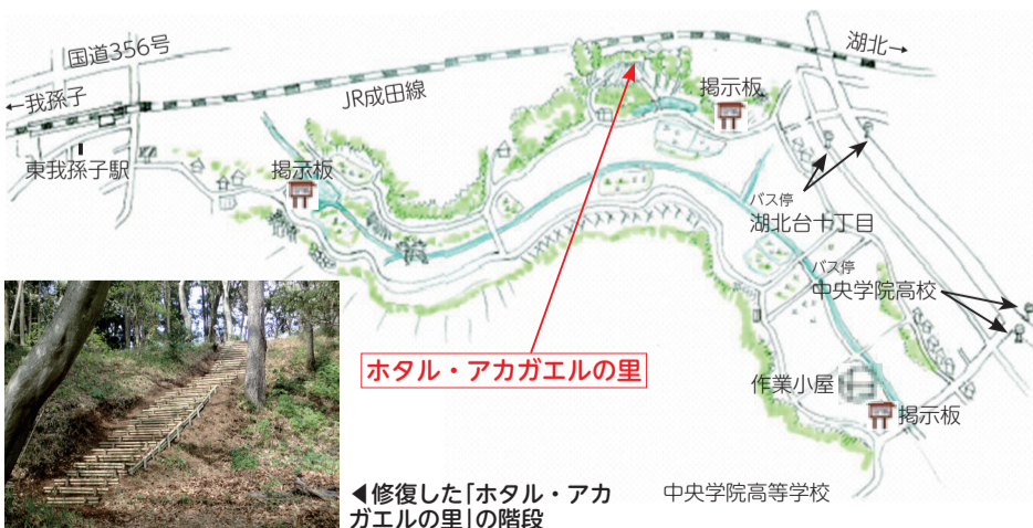
◀修復した「ホテル・アカガエルの里」の階段