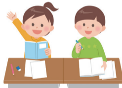
図 教育委員会指導課 ☎7185-1367