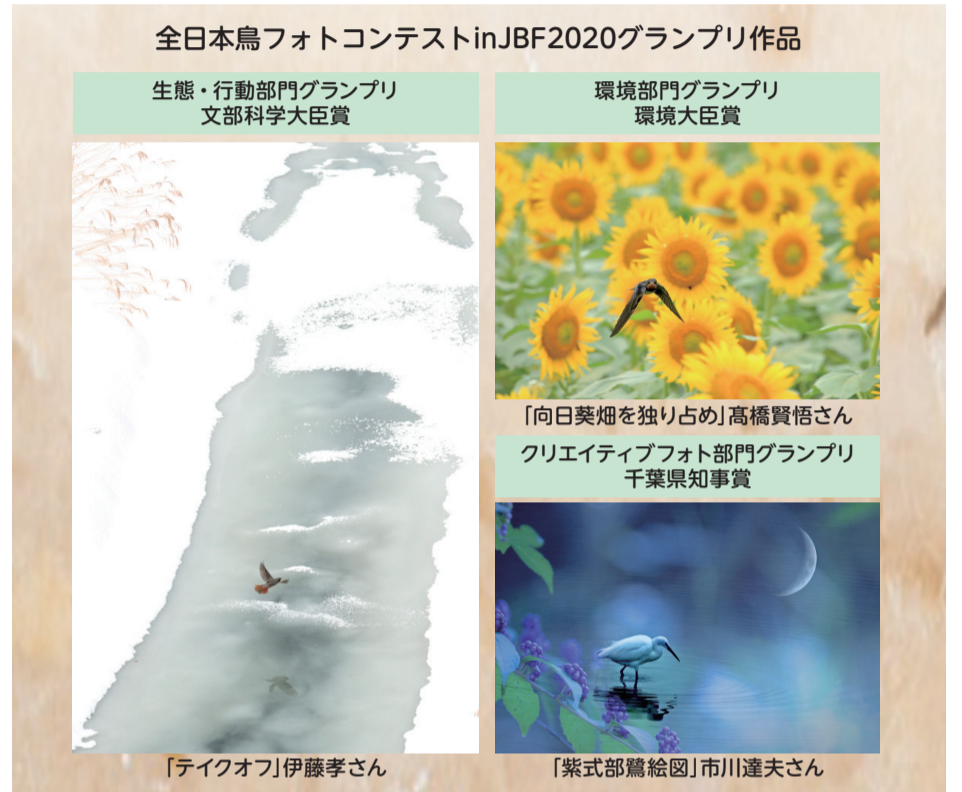
全日本鳥フォトコンテストinJBF2020グランプリ作品

③クリエイティブフォト部門(グランプリは千葉県知事賞)…撮影した鳥の写真を、デジタル加工技術などを用い、より鳥の魅力や芸術性を高めた写真※印刷した写真に加工を施したものは不可。画像加工済みのデータを印刷して応募