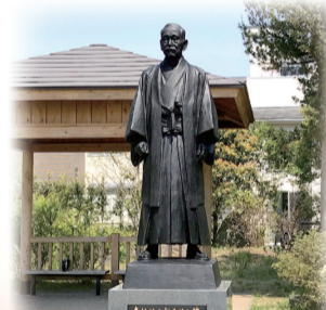
高納治五郎先生之像