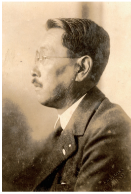
図 杉村楚人冠記念館 ☎7187-1131