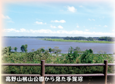
高野山桃山公園から見た手賀沼