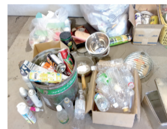
▲空き缶の回収用具に入っていたペットボトルなど