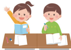
図 教育委員会指導課 ☎7185-1367