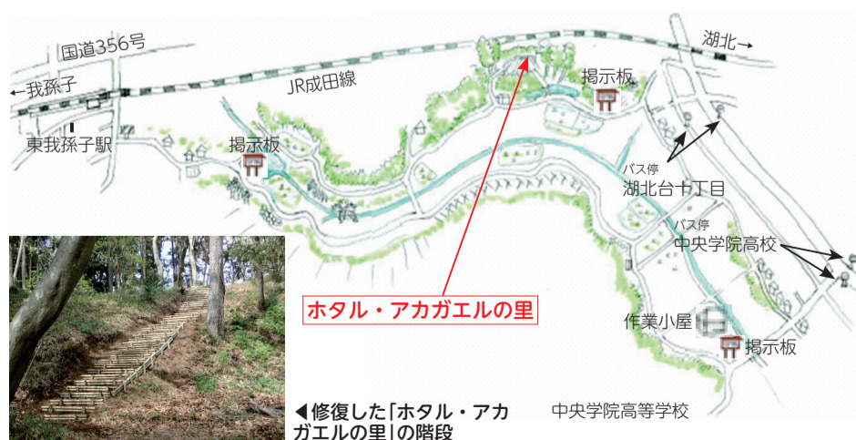
◀修復した「ホテル・アカガエルの里」の階段