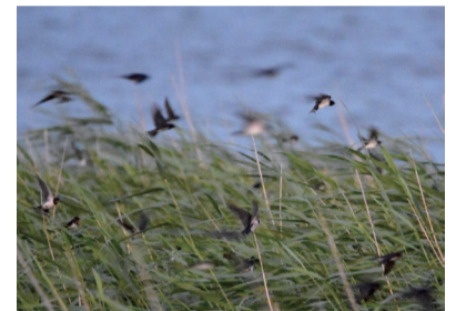
▲ヨシ原のねぐらに入るツバメの群れ