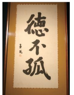
▲志賀直哉書「徳不孤」(徳は孤ならず)