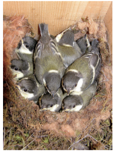
▲巣立ち直前のシジュウカラのひな