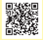
▲ワクチンパスポート

※対象地域およびその緩和措置については外務省海外安全ホームページでご確認ください。 ※引っ越しなどにより1回目と2回目で住民票を異動している場合、各自治体に申請が必要です。 ※通常は申請から約10日後 (市内在住の場合) にワクチンパスポートを発送しますが、必要書類に不備がある場合は2・3カ月かかることがあります。 ※帰国時は、厚生労働省が定める「14日間の待機期間中」のルールを順守してください。