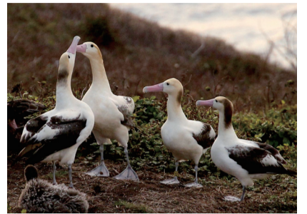
▲「アホウドリ」のつがい(左2羽)と「センカクアホウドリ」のメス(右2羽)。

視聴方法 鳥の博物館ホームページ(QRコード参照)に掲載のリンクから動画サイトで配信