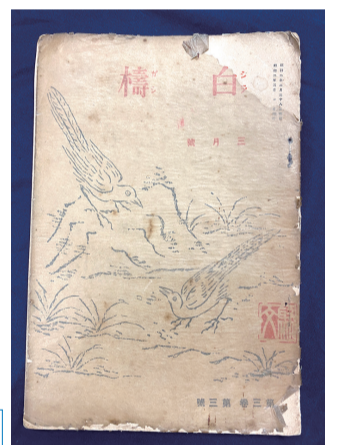
▲『白樺』3巻3号 表紙絵 原田京平(個人蔵)