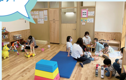
▲新しく開設した「すまいる広場」の様子