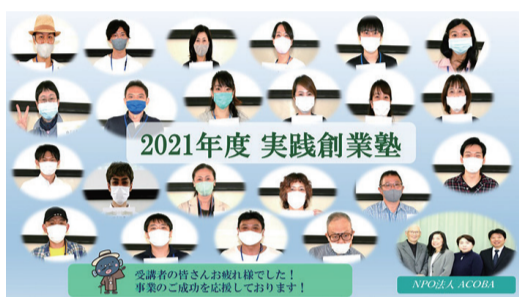
▲昨年度の修了生の皆さん

☎・☎ 9月8日(木)までに電話・ファクス・Eメールで住所、氏名、電話番号、Eメールアドレスを明示。NPO法人ACOBA ☎7181-9701 FAX7185-2241 ✉acoba@key.ocn.ne.jp