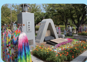
▲平和の記念碑・平和の灯