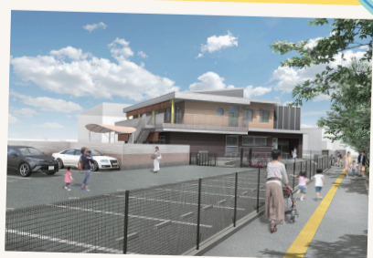
▲駐車場イメージ(令和5年2月完成予定)