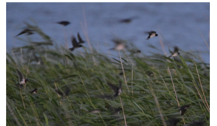
▲ヨシ原のねぐらに入るツバメの群れ