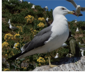
▲ウミネコ(カモメの一種)