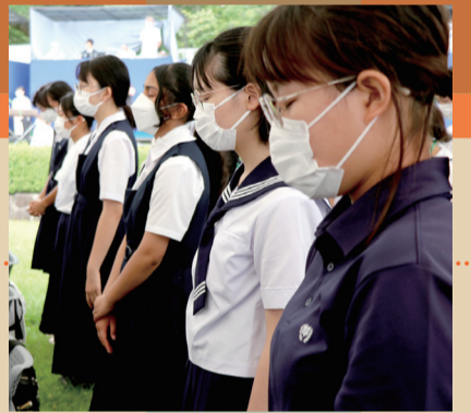
▲広島平和記念式典