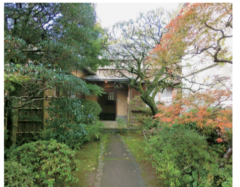
▲旧武者小路実篤邸跡