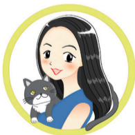
▲アルテイシアさん(SNSのプロフィール画像)

定 先着50人 費 無料 申 市ホームページに掲載のちば電子申請サービス 問 秘書広報課男女共同参画室☎04-7185-1752