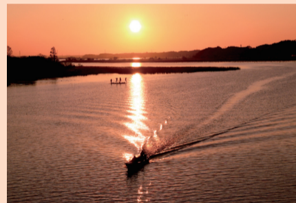
▲優秀賞「朝陽で輝く銀波」