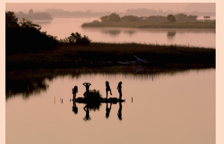
▲優秀賞「朝のマゼンター」