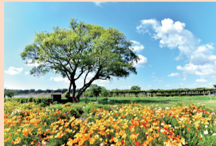
▲最優秀賞「薫風の頃」