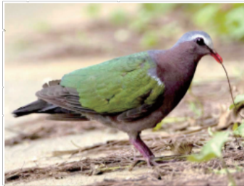
▲キンバトの雄