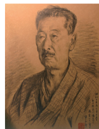
▲伊原宇三郎作 楚人冠デッサン

場所・☎・☎ 7月20日(火)～開催日前日に杉村楚人冠記念館 ☎7187-1131