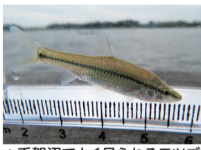
▲手賀沼でよく見られるモツゴ