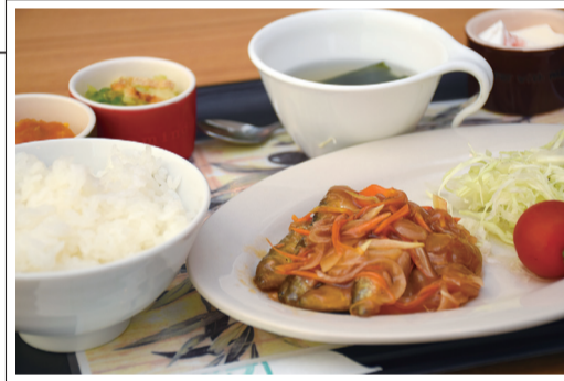
◀カフェの日替わりメニュー 「小イワシのマリネ」