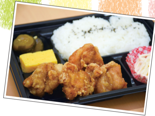
▲大人気の日替わり弁当「唐揚げ弁当」

手頃な価格でバラエティー豊かなお弁当を提供しています。定番メニュー、日替わり弁当、夏・冬限定のお弁当があり、会社・福祉施設・イベント会場などへ配達も行っています。