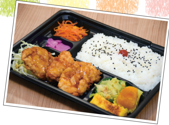
▲日替わり弁当 「鶏肉の甘酢あんかけ」