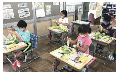
▲食育の授業でトウモロコシの皮むきをする子どもたち

市内小・中学校では、子どもたちへの食育を推進するため、学校ごとに月2回程度「我孫子産野菜の日」を設けています。この日の給食には地元農家が収穫した野菜を使用し、食育の授業を実施する小学校もあります。また、給食のお米は全て我孫子産で、1年を通して地元の旬な農産物を味わえる給食を提供しています。