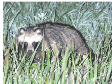
▲利根川の河川敷に生息するタヌキ