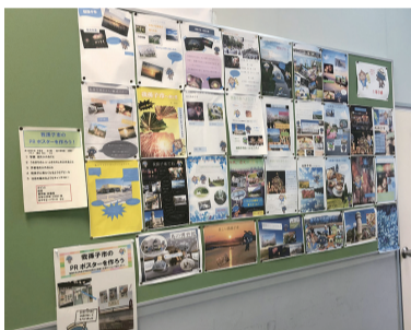
▲布佐中学校での展示