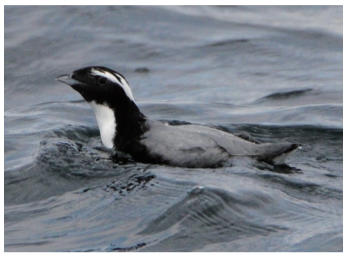
▲鳥島で繁殖するカムリウミスズメ

視聴方法 鳥の博物館ホームページ(QRコード参照)に掲載のリンクから動画サイトで配信