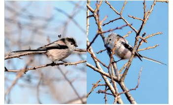
▲通常のエナガ(左)と眉の薄いエナガ(右)

Abiko City Museum of Birds 234-3 Konoyama Abiko ☎7185-2212