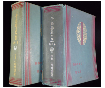
▲図鑑『日本の鳥類と其の生態』