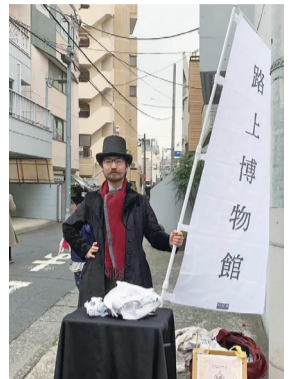
▲路上博物館の原点