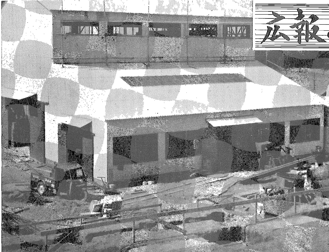
業務を開始した日鑄株式会社