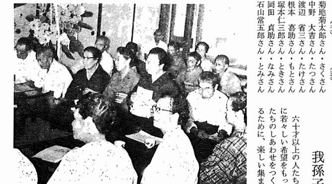
【我孫子老人クラブ結成会に集まったおとしよりのたち】

敬老・母子家庭慰安の会 九月十日(日)現在で、市内に引続き五年以上居住している満九十歳以上のおとしよりの七人に対して、果からの敬老金支給。