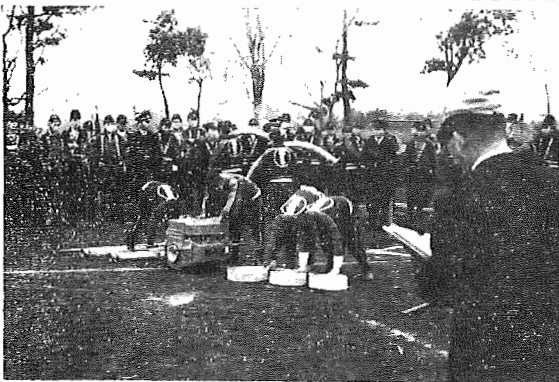
〔写真上……ポンプ操法大会 写真右……パレード〕

二十六日の防火週間第一日は、午前六時全町いっせいにサイレン吹鳴と警鐘の打鐘をおこない、火災予防宣伝巡回をおこなうとともに、各分団の消防団長、器具整備点検を行いました。各分団とも異状は認められませんでした。