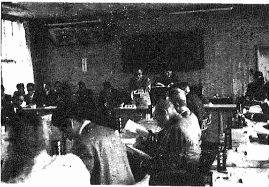
(5月30日臨時町議会を招集...提案理由を説明する町長)

五月三十日から六月十日までの十二日間(内延長五日間)の会期が開かれた第三回臨時町議会は、三十八年度予算案など二十二件について審議しました。 一 時五百万円を借り入れ 二 尿処理施設整備事業 三 天王台土地区画整理事業 四 天王台土地区画整理事業 五 借入金 六 借入金 七 借入金 八 借入金 九 借入金 十 借入金 十一 借入金 十二 借入金 十三 借入金 十四 借入金 十五 借入金 十六 借入金 十七 借入金 十八 借入金 十九 借入金 二十 借入金 二十一 借入金 二十二 借入金