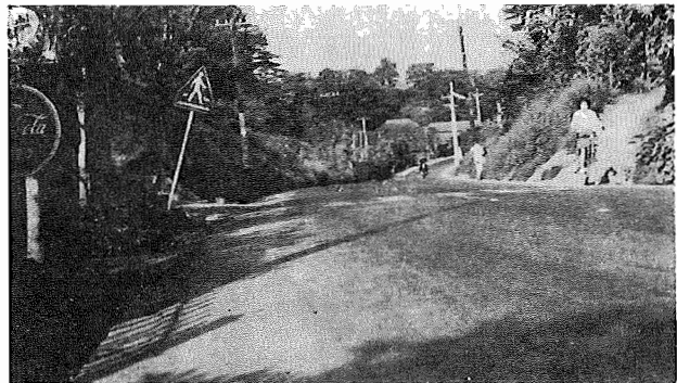
三月末に完成した下ヶ戸地先の県道