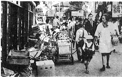
写真 せっかく駐車禁止をしたのに、物置や自転車置場になる道路