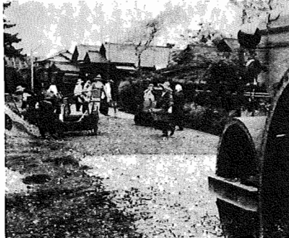
布佐にまで完成した。現在、工事現場の舗装工事、道路舗装工事による対策、失業者対策、宛作と布佐小通学道路が完成。写真はガサラ坂通りの舗装工事現場

六月二十日から六月二十九日まで ▲ 選挙人名簿の総覧および異議の申立期間 八月二十六日から九月九日まで ▲ 我孫子町役場及び各支所 ▲ 選挙人名簿の確定 九月三十日 ▲ 調査事項 氏名、生年月日、筆頭者住所、住民登録の有無、福祉年金受給の有無、国民健康保険加入の有無などです。