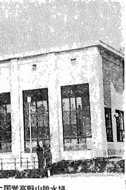
完成した国営高野山排水塔

ニューカッスル病という言葉をよく聞かれますが、これはアメリカ、ニューカッスル地方で始めて発見された鶏の病気で、