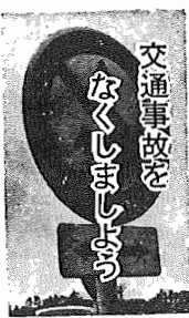
交通安全防止のポスター

湖北中名義美登利「交通安全防止」について、作文を書いたことがあったが、布佐で起きた事故のことを思い浮かべられた。私は、今まで交通安全とは都合で多く起るものと、それほど身近に感じていなかった。テレビのニュースや、新聞などで、事故を知っても、「かわいそうだなあ」とか、「世の中にひどい人がいるんだな」と思うくらいで自分では、あまり関係がない事だ、と思っていた。