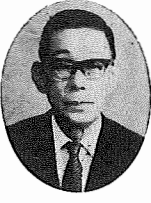
町民のみならず、新年明けましておめでとうございます。

本年は、湖北台公団入居十月予定に伴う小中学校の新設、常磐線の複々線化に伴う天王台駅の早期認可と立休交差の促進、併せて道路網整備、我孫子駅前都市計画改造の促進、人口増加に伴う小中学校の増設と県立高校の誘致、浄水道実現に奔走してまいりました。