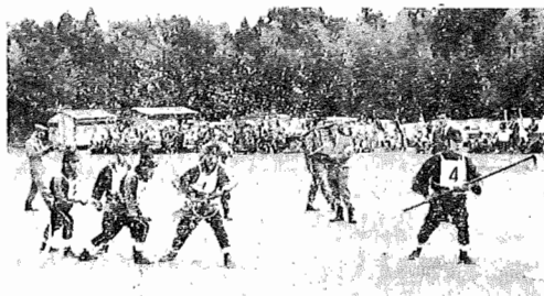
権ヶ谷町で行われた郡操法火大