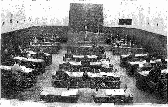
議 会 定 例 会 最 後 任 期 員 會 市

我孫子市市長 述べる一般報告の市政 日本住宅公団我孫子都市計画湖北台土地区画整理事業が昭和四十六年五月十四日完了したので、施行区域内の従前の道路を廃止し、新たに土地区画整理法及び道路法により市道に認定したもので、 市道路線の認定 否決 高野山早稲田団地の私道寄附したい旨、申請がなされたので、市道認定するため提案しましたが、否決となりました。 市道路線の認定 否決 根戸松園団地の私道を寄附したい旨、申請がなされたので、市道認定のため提案しましたが、否決となりました。 昭和三十六年度我孫子市一般会計補正予算(第一号) 原案可決 前年度国庫支出金の精算 収入超過は、グリーンセンター用地取得などの衛生費を追加し、総額二十七億三千八百九十六万五千円になります。 支出では、グリーンセンター用地取得などの衛生費が六千八百二十万四千円、道路整備などの土木費が六千八百二十万四千円、我孫子中学校電気工事などの教育費が九百四十九万八千円、公共用地の取得に対処するため土地開発基金繰出金の諸支出金が四千九百万円等が主要なもので、その他でも若干の経費の補正を行なったもので、 歳入では、地方交付税、市債、繰越金等で充てております。 昭和三十六年度我孫子市国民健康保険事業特別会計補正予算(第一号) 原案可決 前年度国庫支出金の精算 土地取得については、原案通り、 グリーンセンター用地として、中幹地先二万九千二百六十二平方メートルを一度五千九百三十三万六千円で買取取得するためのものとして、再び選定されたもので、明治四十二年三月十二日生まれ 略歴 学歴 東北帝国大学医学部卒業 公職歴 現我孫子市教育委員会委員(昭和四十四年一月二十二日就任) 職業 内科医