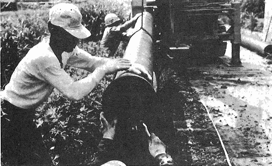
渇水期にそなえ送水管工事を急ぐ……高野山新田地先にて