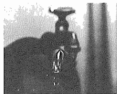
蛇口は正しく止めましょう

調整河川、利根川広域導水路事業で実施する「野田緊急指定導水路」からの水を利用し、将来は、「北千葉導水路」によって開発される水道企業団では、当面の間、流況、原水を利用する計画になっています。