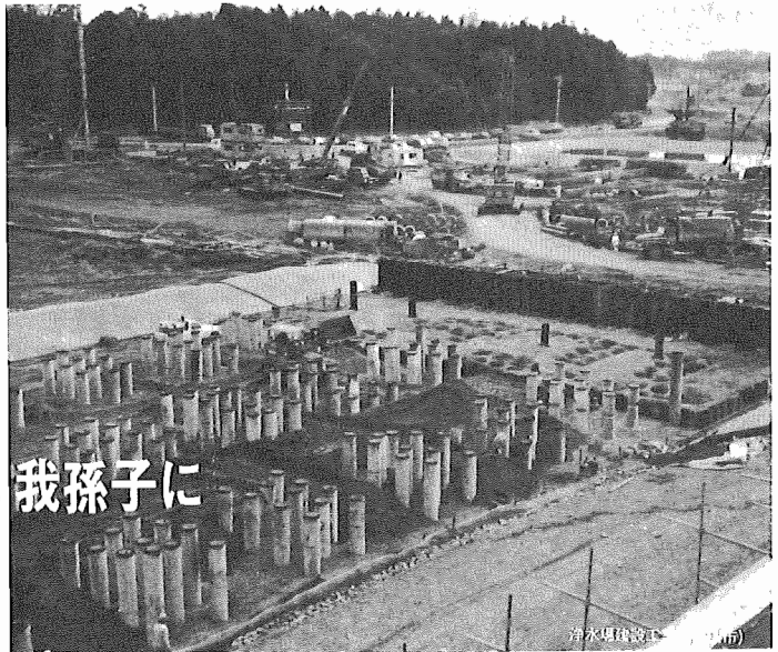
浄水場建設中(我孫子市)

これからまた暑い長い夏がやって来て、ますます水の需要は、うなぎのほりに増えて来ます。 毎年、夏を迎えてくり返される節水の呼びかけ……我孫子市の場合も水資源の確保には苦勞してきました。 今回は、水に悩む我孫子市に一つの光を投げかけてくれる北千葉広域水道事業にスポットをあててみました。 この事業が完成すると、市の水の台所は、ある程度ゆとりが出て来ます。しかし、水資源そのものが有限なものですから、節水の重要性を心に刻み込んでおかなければなりません。かぎりある水を大切に使いたいものです。