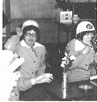
ヘルメットのひもをしめて、地震にたえる作

4月から柏保健所共催で母親学級が始まりました。これは、妊娠中の栄養、新生児の生理衛生、家族計画などについて話し合うもので、毎月、商工会館で行います。