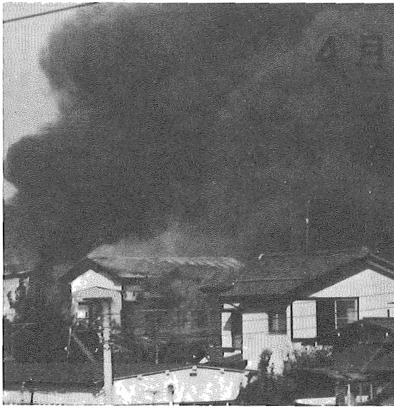
最近 最近にない大火となった栄町の火事

ばでの作業の不注意、天ぷら揚げの不注意、子どもの遊びなどで、場所と状況をよく考えて火を取扱えば、防げた火災も少なくありません。 これからは、日ごとに暖かくなり、ややすと火の取扱いや火に対する注意がおろそかになりがちです。日頃から十分に注意して火災をおこさないようにしたいものです。