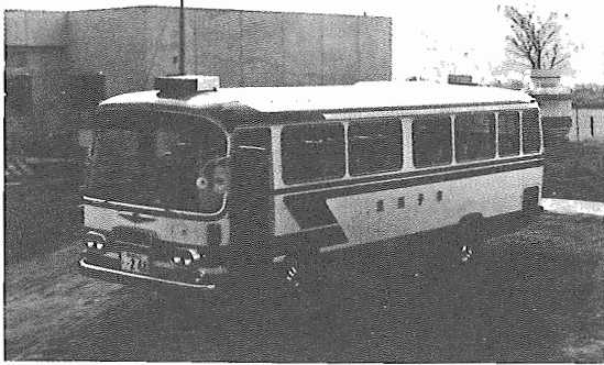
▲市内を巡回する大型バス