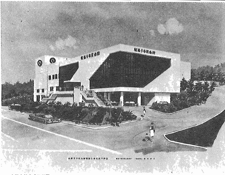
▲市民会館完成予想図