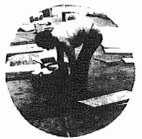
ボランティアの皆さんが時々手伝いに来てくれています。

今年も国際障害者年です。「完全参加と平等」をテーマに、世界各地で運動が押し進められています。そのためにはまず健常者が障害者を正しく理解することが大切です。そして街で、困っている障害者を見かけたら、気軽に声をかけ、手助けをしてあげましょう。