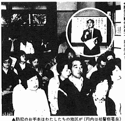
▲防犯のお手本はわたしたちの地区が(円内は柏警察署長)

四月一日から船戸自治会が、「防犯モデル地区」に指定され、防犯モデル地区の看板などを設置する。各家庭の防犯診断を行う。毎月の犯罪発生率を調査し、防犯モデル地区と見なされる。防犯モデル地区の看板などを設置する。各家庭の防犯診断を行う。毎月の犯罪発生率を調査し、防犯モデル地区と見なされる。防犯モデル地区の看板などを設置する。各家庭の防犯診断を行う。毎月の犯罪発生率を調査し、防犯モデル地区と見なされる。