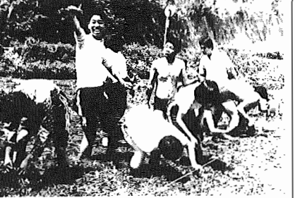
▲田植えをする生徒たち。秋にはおいしいモチを食べます

県立養護学校では、五月十九日と二十日の二日間、近くの田んぼで田植えを行いました。この田んぼは、二毛ほどの広さで、近所の人が貸してくれたものです。 二十一日は、五月晴れのもと、高専部の生徒たちが元気にモチの苗を植えました。初めは慣れない様子でしたが、先生に教わり、上手に植えられるようになりました。なかには、ドロコンになる子もいて、なかなかさややかな田植え風景でした。 秋には、稲刈をし、収穫祭を行います。生徒たちは、おいしいモチを食べながら喜びをかたしめることでしょう。