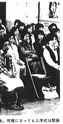
▲お母さんもきょうから1年生。何歳になっても入学式は緊張

市民の手づくりの人物、皮工芸などを展示した第一回春の手芸まつりが、五月二十一日から二十四日まで市民会館で催されました。七宝焼、陶芸、刺繍、人形、アトワラー、ハンフラーなど、二十六の部門に二百名の人が、日頃愛を凝らした作品を持ち寄り、展示しました。 どれも、とてもアツアツが作られたものと思えないようなすばらしい出来栄で、来場した観客さん(寿)も「本職みたいですね、私も習いたくありませんか」と感心ひたしてました。