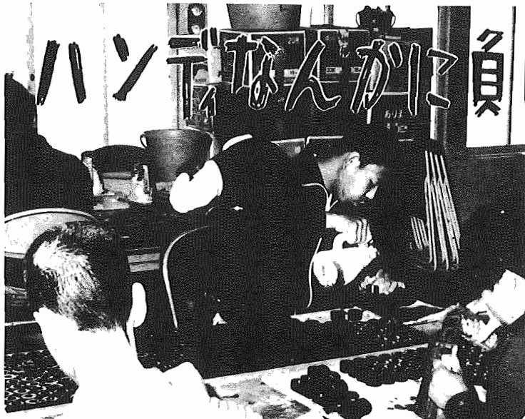
おもちゃのおもづくりをする福祉作業所の利用生。仕事も早く、仕上げも早い。