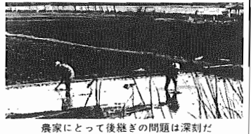
農家にとっても後継ぎの問題は深刻だ

○久喜地区土地盤沈下調査 八百五十万円 ○農林水産費 一億五千八百万円 本市の農業は農地の宅地転用化、農業後継者の不足、生産調整など、様々な問題に直面しています。また自然環境からみても緑地を確保する必要があります。農地整備事業(水田用再帰成) 千五百万円 農道舗装整備 千四百五十万円 農道防除(新潟県水防) 千四百五十万円 ○市振興事業 中小企業保証 投資金一億円 融資利子補助 九百六十万円 商工連携補助 六百五十万円 小規模企業対策(高効率推進五十五万円) 若手会議 百五十万円 消費者事業者懇談会 六十万円 消費生活課 百五十万円