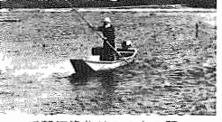
手賀沼浄化はみんなの願い

衛生費 九億八千四百万円 生活のなかから排出されるゴミや汚水の処理するかが問題です。また、市民の皆さんの健康づくりとして病気の早期発見の体制を整えることにも保健センター設置のための用地を取得します。 ○汚泥固形物処理プラント附設 備(汚泥とともに処理する生ゴミの破砕分別機) 七千万円 ○塩化水素自動測定装置(二カ所規模)に伴う測定 九百万円 ○資源化事業(分別収集)に対する自治会等への奨励金 九百万円 ○ごみ不法投棄対策(指導員委託など) 七百万円 ○胃がん、婦人がん検診委託 一千二百五十万円 ○結核検診 麻しん委託 六百万円 ○救急医療 第二次、三次救急医療(ベッド確保、日曜当番医委託 休日当番診療、日曜当番医委託) 五百五十万円 ○手賀沼浄化対策(水質、底質調査など) 二百五十万円 ○古利根水質調査 二百五十万円 衛生費 九億八千四百万円 本市の商業は消費人口が増加したものの近代化が遅れているために都心や近隣市への流出が目立っています。地元商業を振興させるためには商業組織の充実と近代化への援助が必要です。また消費者の立場からは商品の安定供給、安全性に配慮して生活向上に努めます。 ○小規模企業対策(高効率推進五十五万円) ○若手会議 百五十万円 ○消費者事業者懇談会 六十万円 ○消費生活課 百五十万円