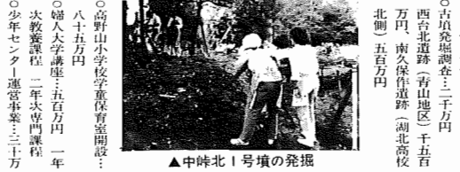
▲中時北1号墳の発掘

予算からみた市のしごと 教育費 三億九千九百九十九万円、警察費 一億九千九百九十九万円、消防費 一億九千九百九十九万円、保健費 一億九千九百九十九万円、福祉費 一億九千九百九十九万円、文化費 一億九千九百九十九万円、その他 一億九千九百九十九万円。