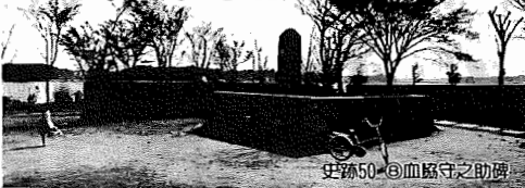
史跡50 血路守之助碑

7月1日現在 ●人口 105,271人(+2,445人) 男 52,642人・女 52,629人 ●世帯数 31,145世帯(+920) ●市役所本庁 85-1111 ●つくし野支所 84-8801 ●湖北支所 88-0828 ●湖北支所 88-2111 ●布佐支所 89-2358 ●水道局 84-0111 ●消防署 84-0119 ●社会教育課 85-1511 ●市史編さん室 85-2481 ●市民会館 84-3311 ●市民図書館 84-1110 ●市民図書館湖北台分館 87-3055 ●生活環境課(し尿・ゴミ) 87-0015 ●つつし荘 88-0123 ●都市改善事務所 85-1171 ●中央公民館 82-0515, 85-0611 ●身体障害者福祉センター 88-0141