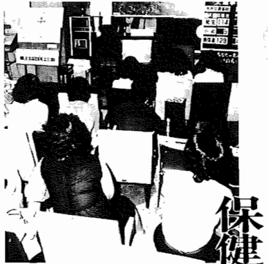
▲市議会をテレビで視聴する市民のみならず