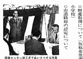
保健センター起工式であいさつする市長

可決された議案 仮称我孫子警察署の誘致について、市議員の定数増を行うもので、市職員定数増等に関する条例の一部改正、市民図書館設置等に関する条例の一部改正、市民図書館設置等に関する条例の一部改正、市民図書館設置等に関する条例の一部改正、市民図書館設置等に関する条例の一部改正。