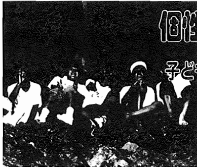
▲昨年のジュニアリーダークラブサマーキャンプで(山梨県小菅村)