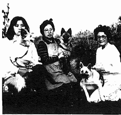
▲「かわいい犬だからこそマナーを守りたいですね」と遊歩道を散歩する奥さん方。

犬は本来忠実で献身的な動物であり、ペットとして飼うことは、個人の自由に関する事です。しかし、地域社会で生活している以上、ルールを守り正しく飼うことが必要となります。そこで、今回は、狂犬病予防注射、飼うときの心がけ、捨て犬について、みなさんにお願ひします。健康管理課子防衛生係