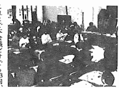
4月に開かれた市民集會