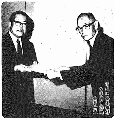
市長に基本構想 を手賀沼のほとり、 やすらぎのまち の将来像

我孫子市の新しい基本構想が、5月14日消防署大会堂で、総合計画審議会の市長、新申され ました。基本構想は、これからのまちづくりの「憲法」ともなるもので、審議では我孫子の 将来の姿を、手賀沼のほとり、やすらぎのまち、そして、まちづくりの生活環境とあ ています。これによって、21世紀に向けての市民行政の共通目標と、それを表現してい くための施策の考え方が示されたことにより、総合計画づくりは昭和62年度スタートを始め大々 く前進しました。