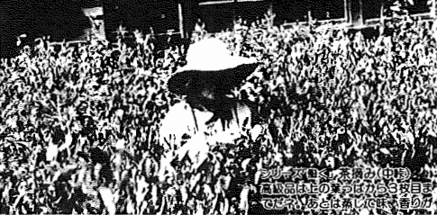
昭和60年5月1日現在 (対前年比) *人口 111,291人(+1,337人) 男 55,738人 女 55,553人 *世帯数 33,720世帯(+554世帯)