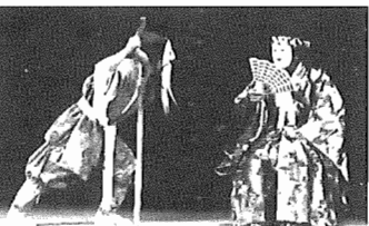
古戸はやし連中の熱演

▼主催 我孫子市、我孫子市教育委員会 ▼問い合わせ 社会教育課 ☎85-1151