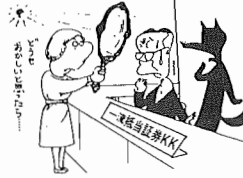
『モーゲージ証券』とは、いったい何なのですか。等の問い合わせが多い様です。

近頃の貯蓄ブームで、新聞や雑誌を賑わしている抵当証券とはどういふものか。『モーゲージ証券』とは、いったい何なのですか。等の問い合わせが多い様です。