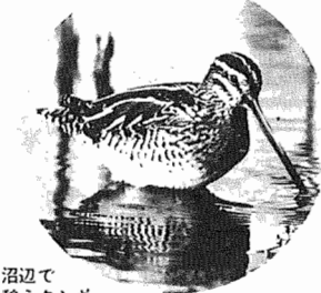
沼辺で憩うタシギ