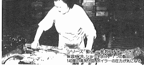
シリーズ「働く三世代のついで」 柏保健所、シヨクシヨク、1つの取組で 14歳の気取ったハイパーの圧力が気になる

昭和61年11月1日現在 (対前年比) ●人口113,367人(+1,353人) 男56,852人 女56,515人 ●世帯数34,736世帯(+758世帯) ●市役所本庁 85-1111 ●つくし野支所 84-8801 ●湖北支所 88-0828 ●湖北台支所 88-2111 ●市支所 89-2358 ●教育委員会 85-1151 ●水道局 84-0111 ●消防署 84-0119 ●少年センター 84-1900 ●市史編さん室 85-2481 ●保健センター 87-1131 ●市民会館 84-3311 ●市民図書館 84-1110 ●市民図書館湖北台分館 87-3055 ●市民図書館移動図書館 87-0909 ●中央公民館 82-0515 ●市民体育館 87-1155 ●都市改造事務所 85-1171 ●身体障害者福祉センター 88-0141 ●つつし荘 88-0123 ●生活環境課(浄化槽) 87-2379 (ゴミ)87-0015 (し尿)88-2547