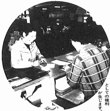
届出により市民としての権利が生じます。

暮らしの節目に届出を 転居、結婚、出生など、日々の暮らしの節目には市役所への届出が義務付けられているものがあります。今回は窓口での諸手続きについてご紹介します。ご参考にしてください。 ——市民課——