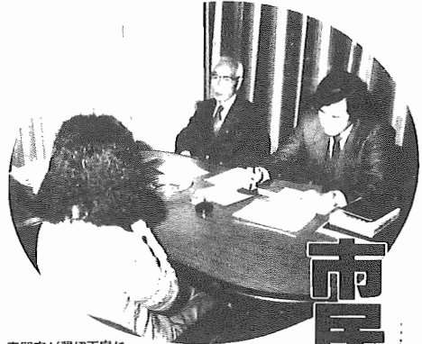
専門家が懇切丁寧に アドバイス＝年金相談で＝

私達が毎日生活する上で、困ったこと、悩 みごと、トラブルに出会うことはしばしばあ るものです。こんな時、ひとりで悩んでた り、考え込んでいるばかりでは、いつまでた つても解決の糸口は見つかりません。市民相 談室は、あなたの相談相手です。個人的な事 から市政に関する問題まで、あらゆる相談を 受け、皆さんが抱えている問題の解決に努め ます。プライベートな内容の場合、秘密は厳 守されますので、気軽にご利用ください。