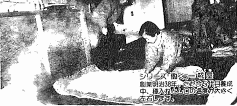
シニアズ「前」=花壇 創業明治38年、今年合併目録成 中、種人カシ人の急増がたくさ く左右する。

昭和62年2月1日現在 (前年比) ●人口113,719人(+1,555人) 男57,027人 女56,692人 ●世帯数34,808世帯(+762世帯) ●市役所本庁 85-1111 ●つくし野支所 84-6801 ●湖北台支所 88-0828 ●湖北支所 88-2111 ●市佐支所 89-2358 ●教育委員会 85-1151 ●水道局 84-0111 ●消防署 84-0119 ●少年センター 84-1900 ●市史編さん室 85-2481 ●保健センター 87-1131 ●市民会館 84-3311 ●市民図書館 84-1110 ●市民図書館湖北台分館 87-3065 ●市民図書館移動図書館 87-0909 ●中央公民館 82-0515 ●市民体育館 87-1155 ●都市改造事務所 85-1171 ●身体障害者福祉センター 88-0141 ●つづし荘 88-0123 ●生活環境課(浄化槽) 87-2379 (ゴミ)87-0015 (し尿)88-2547