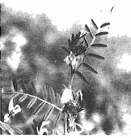
カラスノエンドウ (まめ科)

4・5月の野山は、花新緑で華やかである。多くの花に混つて、カラスノエンドウも花を伸ばし、四月の初旬には花をつけるものも現れた。この草はつる性で、別名をヤハズノエンドウという。