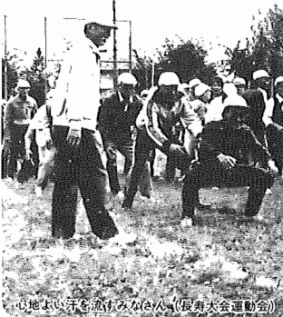
心地よい汗を流すみなさん(長寿大会運動会)