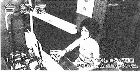
シリーズ「あひこ」のタイプライター 納期をまもって、仕立てをキレイに。

昭和62年5月1日現在 (対前年比) ●人口114,213人(+1,529人) 男56,336人 女56,877人 ●世帯数35,226世帯(+808世帯) ●市役所本庁 85-1111 ●つくし野支所 84-8801 ●湖北支所 88-0828 ●湖北支所 88-2111 ●市佐支所 89-2358 ●教育委員会 85-1151 ●水道局 84-0111 ●消防署 84-0119 ●少年センター 84-1900 ●市史編さん室 85-2481 ●保健センター 87-1131 ●市民会館 84-3311 ●市民図書館 84-1110 ●市民図書館湖北分館 87-3055 ●市民図書館移動図書館 87-0909 ●中央公民館 82-0515 ●市民体育館 87-1155 ●都市改造事務所 85-1171 ●身体障害者福祉センター 88-0141 ●つづし荘 88-0123 ●生活環境課(浄化槽) 87-2379 (ゴミ)87-0015 (し尿)88-2547